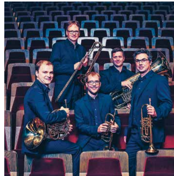
Gewandhaus Brass Quintett

Ludwig van Beethoven Streichquartett c-Moll op. 18/4 Streichquartett Es-Dur op. 74 (»Harfenquartett«) Streichquartett a-Moll op. 132