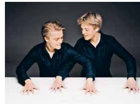
Lucas & Arthur Jussen